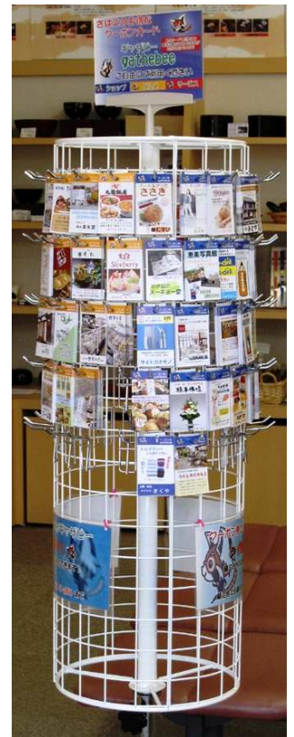
カード設置ラックは市内約 10 箇所に配置予定

参加費： 3,000 円 (クーポンカード 500 枚作製費含む/追加は 500 枚につき 2,000 円)