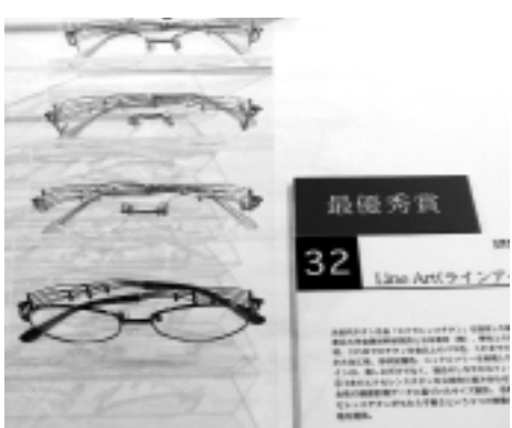
最優秀賞のラインアートシリーズ