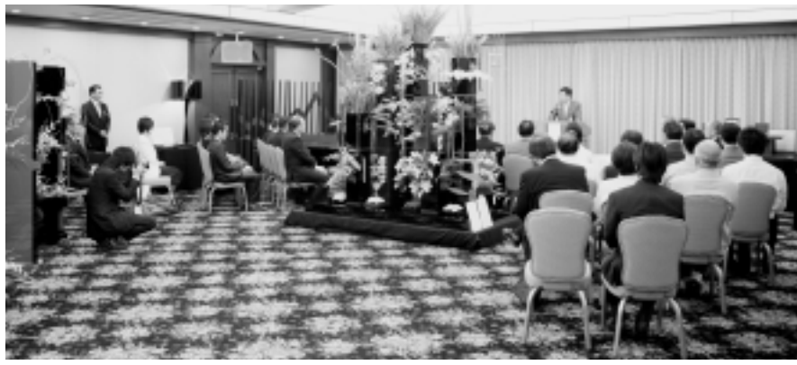
リアルジャパン展示発表会

「REAL JAPAN」は、「厳選された素材、卓越した匠の技、磨ぎ澄まされたデザイン」をコンセプトに、日本全体を一つの漆工芸の産地と捉え、世界に向けたブランド化を図ろうと鯖江市内のメーカー三社が中心となってスタートしたプロジェクト。中小企業庁の「JAPANブランド育成支援事業」の採択を受け、平成十九年度から取り組んでいます。