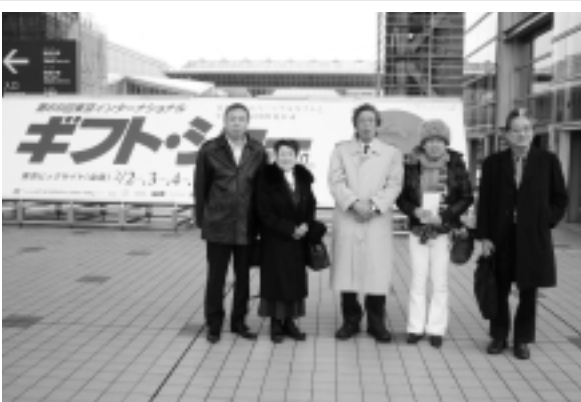
ギフトショー会場前にて

班にわかれ、鯖江商工会議所全国展開事業として出展のブースや越前漆器協会のブースを中心に見学しました。その後、全国の先取りした商品やバイヤーの反応を視察。今後のサービスの提供や演出に少しでも役に立つよう、広い敷地内を時間のゆるす限り見学しました。旬のトレンドを満喫した有意義な一日となりました。