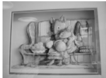
シャドーボックス

掛けています。平成十七年には民間車検指定工場としての許可を取得し、よりお客様へのニーズに答えられる修理工場に生まれ変わりました。今までも、「早い・安心・低価格」な車検を提供したいという思いからです。一日車検もOKです。私たちが目指すのは、お店への信頼や頼れる整備技術はもちろん、「近くまで来たからちよつと寄ってみよう」と気軽に立ち寄れるお店作りをすることです。いつ来店してもホッとできる そんなあなたにかなないモーターズでありたいと願っています。