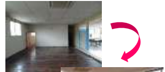
(中小企業経営強化税制の強化イメージ)