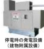
停電時の発電設備 (建物附属設備)