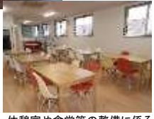
休憩室や食堂等の整備に係る 建物附属設備等が対象に