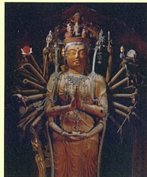
「谷田寺」千手観音立像