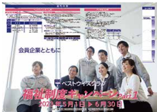
鯖江商工会議所 地域振興・会員サービス課 一連絡先- 0778-51-2800

当所職員とアクサ生命保険株式会社の担当推進員がお伺いした際には、是非ご協力、ご配慮いただきますようお願い申し上げます。