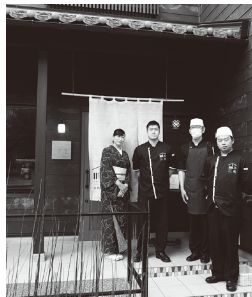
表紙 会員事業所紹介 料亭カフェ「茶癒SaYu中松」