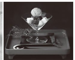
濃茶パフェ 880円(税込)