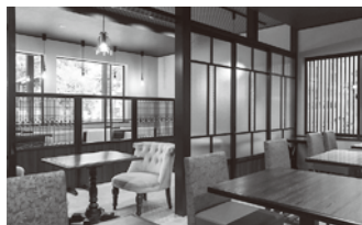
レトロな雰囲気の店内