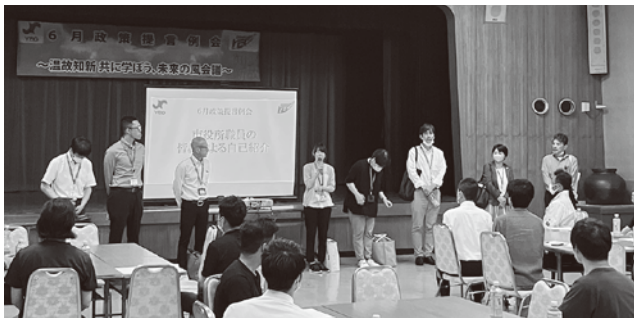
参加いただいた鯖江市職員の皆さま

青年部では、6月19日(月)鯖江商工会議所にて、青年部政策提言委員会による6月例会が開催されました。