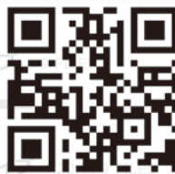
電子広告サンプル 実際の見え方です。