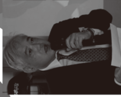
主催者挨拶 日本商工会議所 常務理事 高山一成 氏