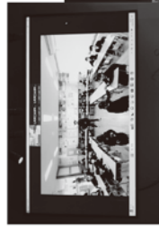
七尾市立山王小学校の児童たちがVRゴーグルを使ってバーチャルショップ等を見学