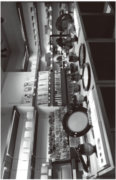
輪島、珠洲、七尾市の商品を展示リアルとオンラインショップで販売