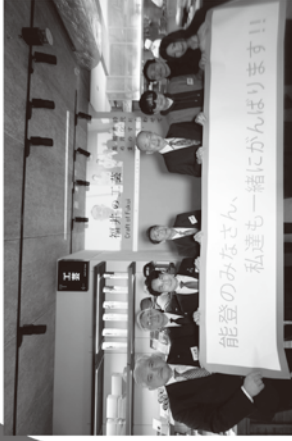
七尾市、珠洲市、鯖江市と会場を繋いでのオープニング

日時 2024年2月13日(水) 9:30-オープニング 13:00-19:00 展示会 14日(木) 10:30-19:00 展示会 15日(金) 10:30-19:00 展示会 会場 ふくい森の園 291