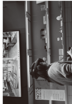
会場では来場者が、バーチャルモールを通して被災地の能登企業のショップ・ファクトリーを見学