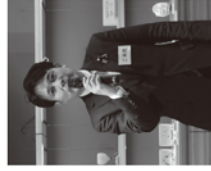
クロージング 参議院議員 黒澤 宏文 氏