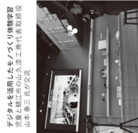
デジタルを活用したモノづくり体験学習 伊原と鯖江市の山久漆工場代表取締役 山本 泰三氏が交流