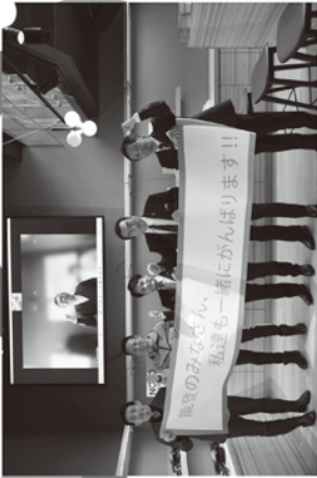
七尾市と会場を繋いでのオープニング

日時 2024年2月6日(火) 10:00-オープニング 11:30-21:00 展示会 7日(水) 9:00-21:00 展示会 8日(木) 9:00-18:00 展示会 会場 ふくい南青山291