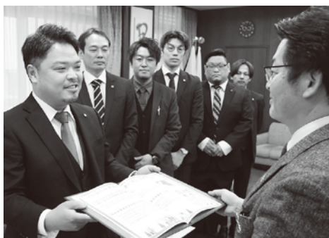
提言書を渡す上出会長ら

後日、青年部のホームページにて提言書がアップされますのでご確認ください。政策提言のアンケートに答えていただいた皆様、ありがとうございました。