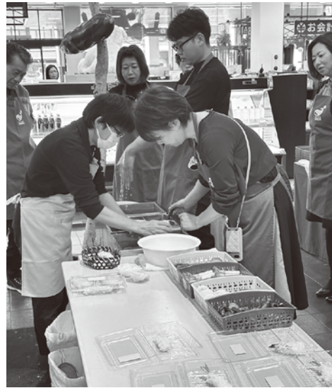
食品サンプル製作体験

ルのサンプルを作成していました。昼食は、「郡上八幡ホテル積翠園」にて岐阜県の郷土料理である朴葉焼きをいただきました。風味豊かな香りの料理に、参加者一同、食事を堪能しながら和やかに交流を深めました。昼食後には、「郡上八幡博覧館」へ移動し、国の重要無形民俗文化財にも指定されている「郡上踊り」を体験。博覧館のスタッフの方から、踊りの由来や歴史を学び、実際に指導頂き、基本的な振り付けを練習しました。研修の最後は、清らかな水が流れる水路や、歴史を感じさせる家々が残る郡上八幡の自由散策を行いました。各自、思い思いの時間を過ごし、日本最古の木造城である郡上八幡城や、水の町郡上八幡を満喫しました。今回の視察研修は、食品サンプルという「技術」、郡上踊りという「伝統」、そして郡上八幡の「文化」、これら全てを体験できる非常に有意義な一日となりました。参加者一同、今回の体験で得られた「ものづくり」や「地域文化」への理解を、今後のサービス業における付加価値創造や、お客様への「おもてなし」の向上に活かしていきたいと考えています。